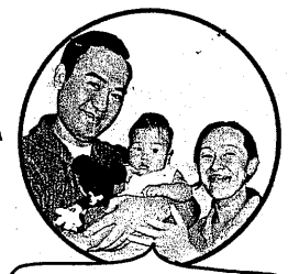
日系ブラジル人家族

とき：11月11日(日) 9時30分～11時30分 ところ：「あすてらす」2階 研修室5